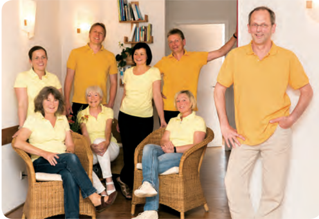
Das erfahrene Therapieteam hilft ganzheitlich bei schweren Augenleiden